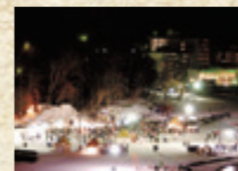
阿寒湖水上フェスティバル