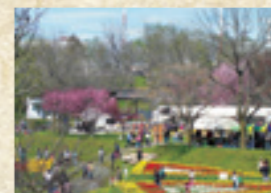
チューリップ&花フェア

釧路の夏を彩る最大のお祭り! 「大漁ばやしパレード」・「市民踊りパレード」・「音楽パレード」の三大パレードを中心に、歩行者天国や各種イベントが催され、短い釧路の夏を全身で味わうことができます!