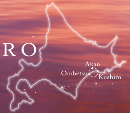
マリモの眠る阿寒湖