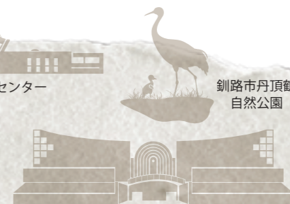
釧路市丹頂鶴自然公園