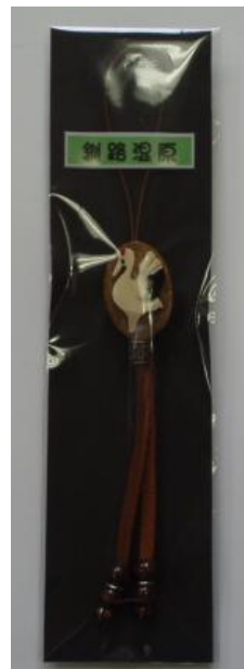
G. 丹頂鶴ストラップ楕円