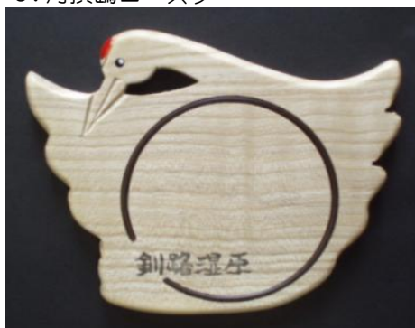
J. 丹頂鶴コースター