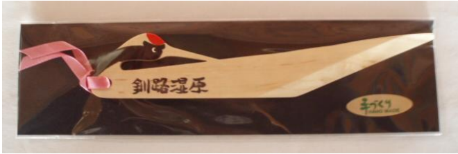
A. 丹頂鶴ペーパーナイフ