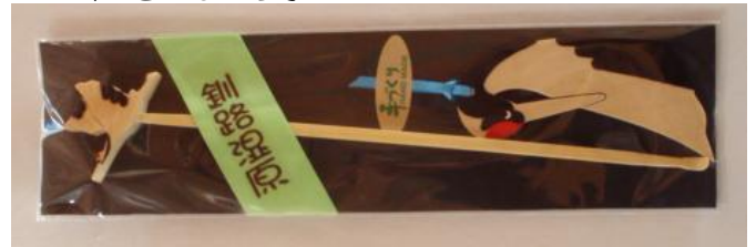
B. 耳かき・しおり小ツル