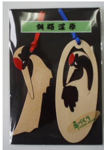
D. しおり (大・小) ツルセット