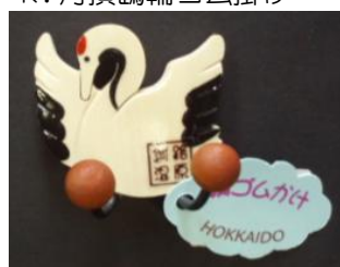
K. 丹頂鶴輪ゴム掛け