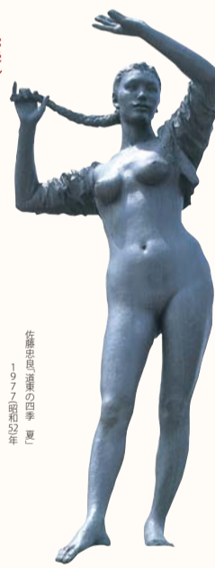
佐藤忠良 道東の四季「夏」 1977(昭和52年)