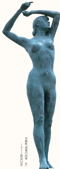
本郷新 道東の四季「冬」 1977(昭和52年)

現在5代目となる幣舞橋。北海道三大名橋の一つと謳われ、長年親しまれてきた前代の橋が、老朽化のため架け替えられることになったとき、市民の中から「新しい橋も名橋、幣舞橋としての名に恥じないものにしよう」との声があがり、「新幣舞橋の造形を考える市民懇話会」が発足。様々な案が検討された結果、4作家にそれぞれ1体の女性像を制作依頼し、4本の橋脚に飾るといって、全国的にも珍しい姿が考案されました。市民からの募金も予想をはるかに超える額が寄せられ、1977(昭和52)年5月3日完成。市民の愛情あふれる橋として、またお天気カヌーでおなじみの釧路市の顔として親しまれています。