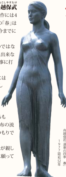
舟越保武 道東の四季「春」 1977(昭和52年)