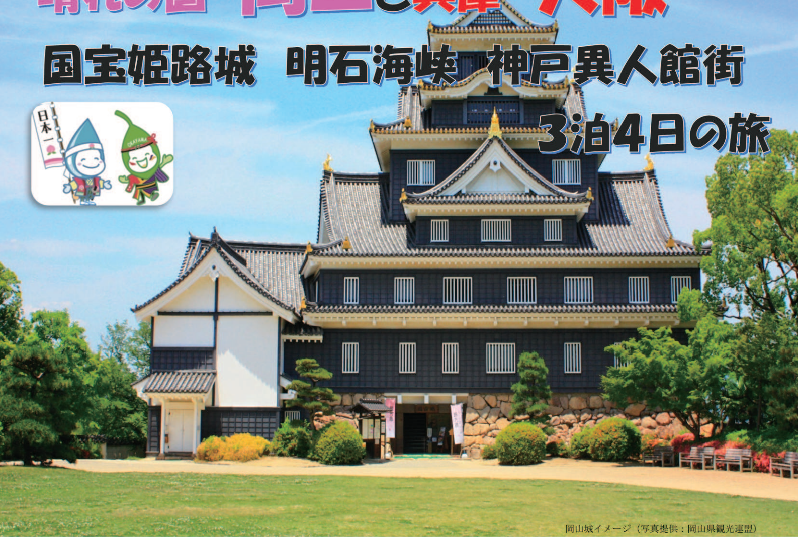
岡山城イメージ