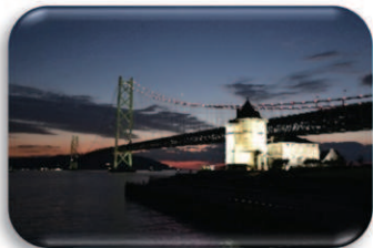
明石海峡大橋夜景・神戸異人館街イメージ