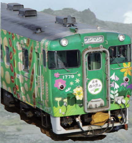
※写真はすべてイメージです。

出発日：2019年8月8日(木)日帰り 募集期間：7月1日(月)～7月24日(水) 募集人員：50名様(長期滞在者30名様・市民20名様) 最少催行人数45名様, 先着申込完了順